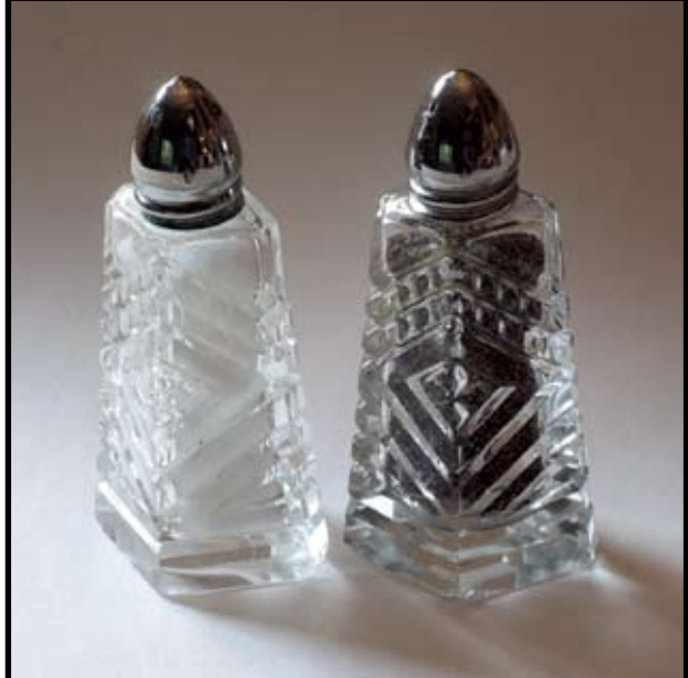
הרב אלימלך למדן, מחבר הספר ”תורפיה“